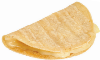
una tortilla de maíz y queso (una quesadilla)