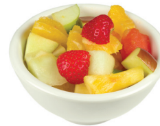
1 taza de fruta