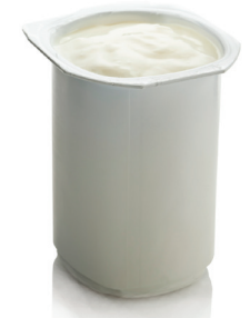
6 onzas de yogurt bajo en grasas