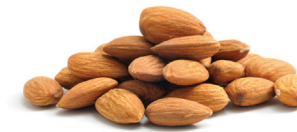
12 almendras o cacahuates