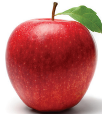
1 manzana mediana